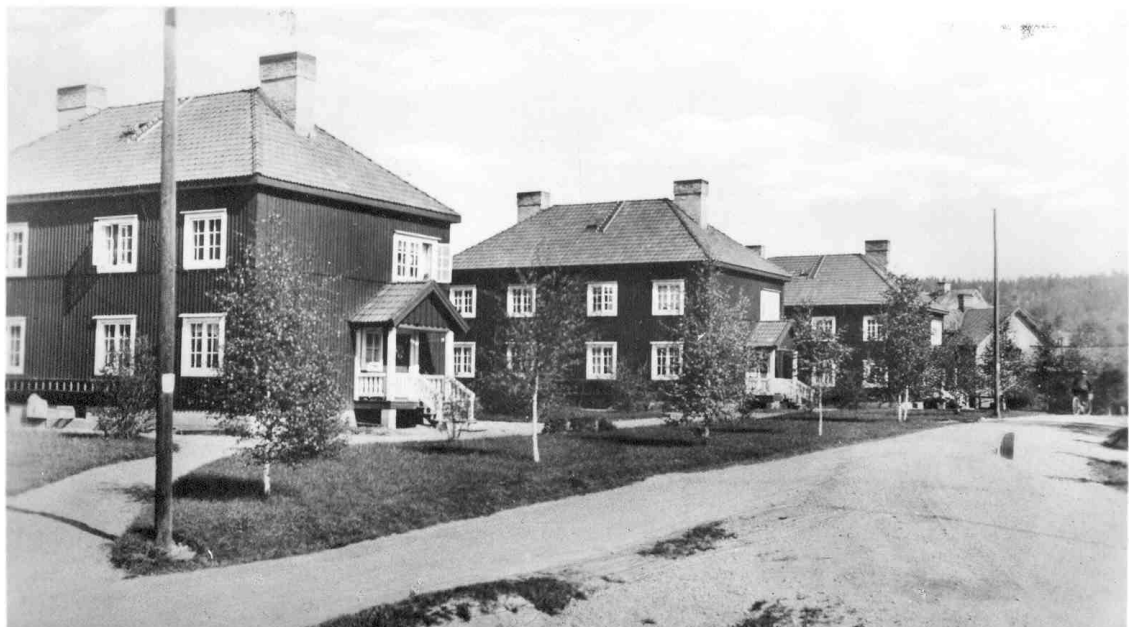
Fig. 53 Ånge 44:9 på 1920-talet med ursprungligt utseende. Köpmangatan.