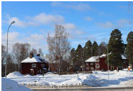
Fig. 49 och 50. ÅNGE 46:1 och 46:3, ÅNGE 46:17 - 21 SJ bostäder vid Vojen.