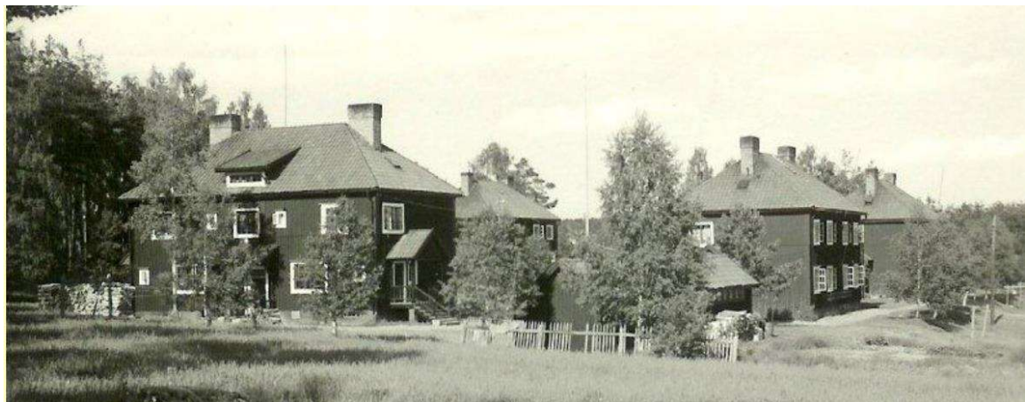
Fig. 51 Historisk bild av fastigheterna ovan.