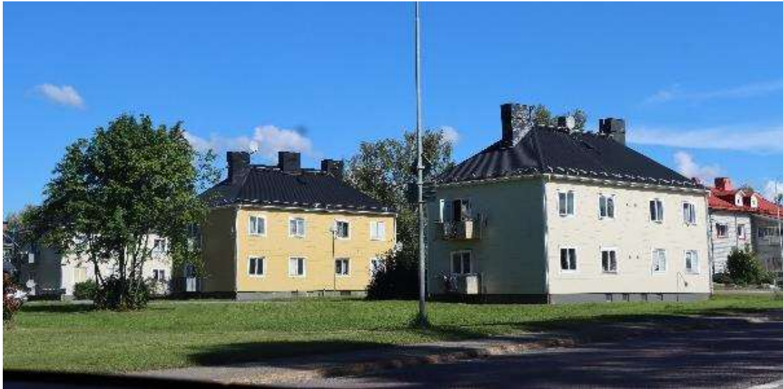
Fig. 52 e SJ- arbetarbostäder Ånge 44:9 de så kallade Skrivarvillorna.