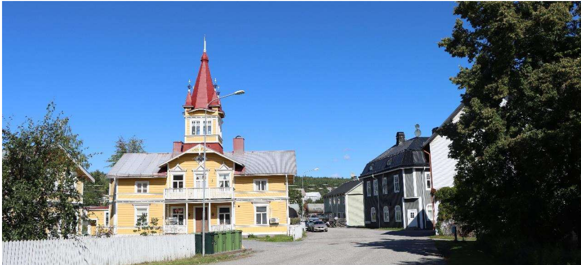
Fig. 48 ÅNGE 43:14 Köpmangatan. Här finns flera värdefulla äldre byggnader.